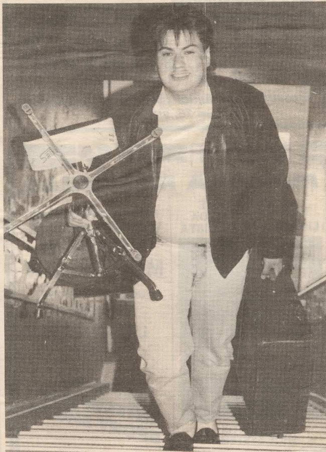
Keikalla käymisen rankin osa on soitinten ja laitteiden kantaminen autoon ja taas illan päätteeksi takaisin.