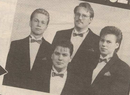
Järj. KK-V, PESÄPALLO