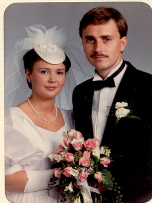
Jokakuva - Turku