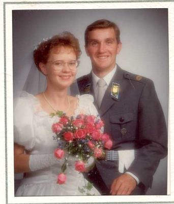
studio liisa siltanen säkyä

Selvä juttu, ota mukaan ystävä ja tuttu ja tule syksyn hurjimpiin NAISTEN BAALEIHIN la 6.10 klo 20—02