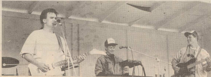
Käräjätalon rannassa pidetyssä rockkonsertissa esiintyivät Zaple Cone (kuvasa), Sweaty Squeeze ja MeltDown. Yleisöä oli tullut paikalle vain kourallinen.

Kaksipäiväiset Henrikin markkinat pidettiin perinteiseen tapaan uimahallin kentällä. Yleisöllä oli tilaisuus tehdä edullisia ostoksia ja seurata vilkasta torielämää. Koko viikon ajan oli