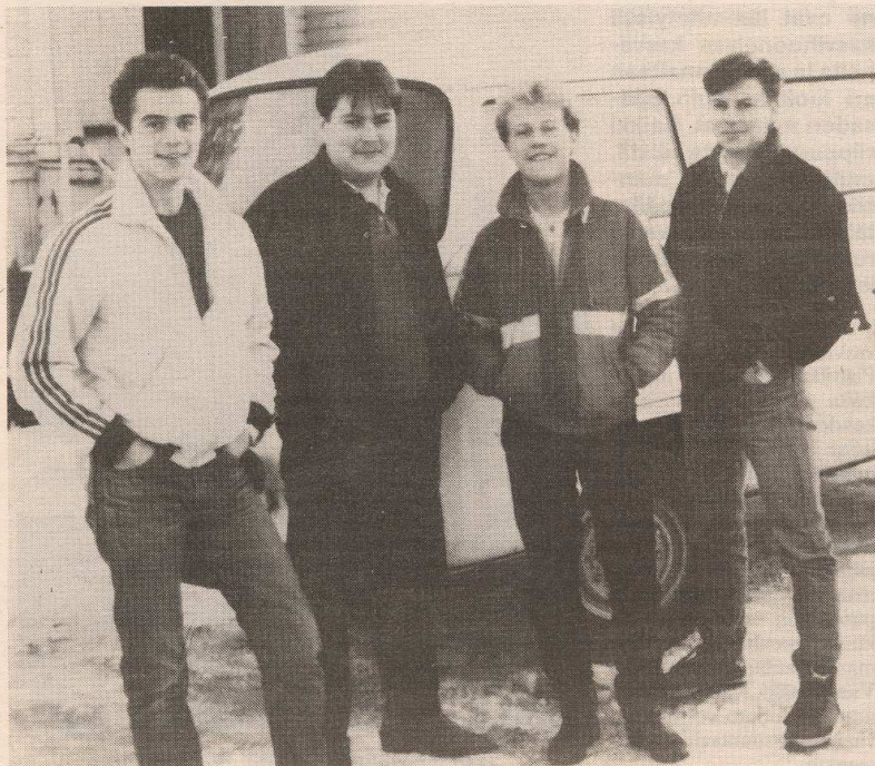
Sahara 10 vuotta sitten. Nämä pojat saatettiin poliisin avustuksella pankkiin.

— Kiitoksen sana kuuluu kyllä kaikille yksityisille henkilöille ja yrityksille, jotka ovat tukeneet meitä. Myös paikallisten orkesterien kanssa ollaan tehty hedelmällistä yhteistyötä. Erityisesti on kuitenkin kiittäminen kaikkien vanhempien, joiden tukea ja apua vailla koko hommasta ei olisi kyllä tullut mitään.